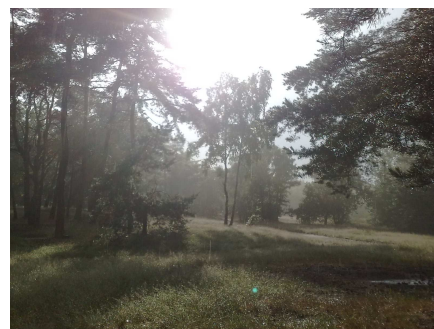
De Heikop na de regenbui

Verkennerleider en redactielid Lopend Vuurtje